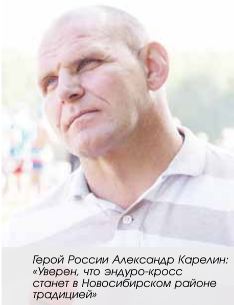
Герой России Александр Карелин: «Уверен, что эндуро-кросс станет в Новосибирском районе традицией»