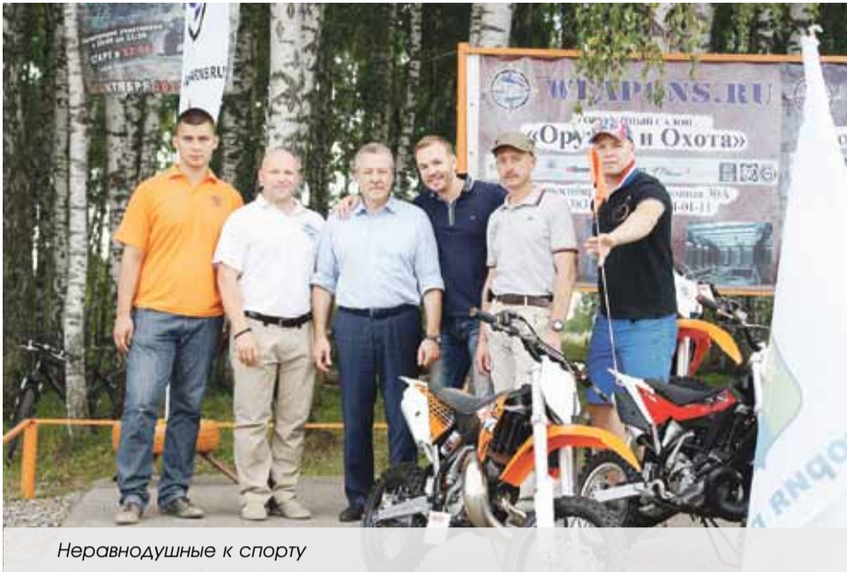
Неравнодушные к спорту