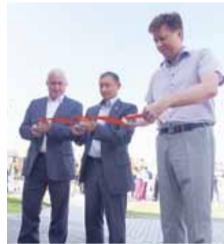
Торжественное открытие СК «Арка»