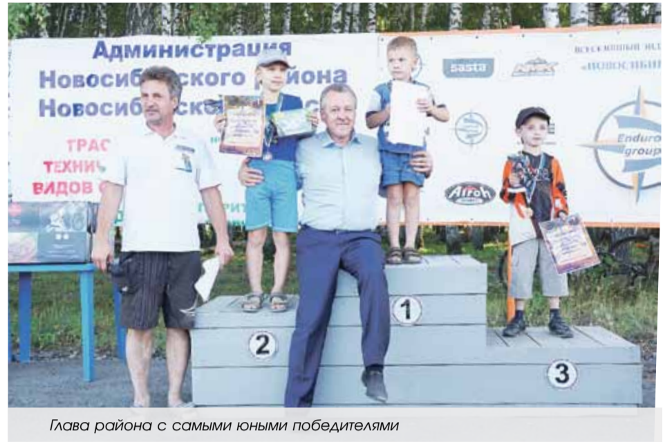
Глава района с самыми юными победителями