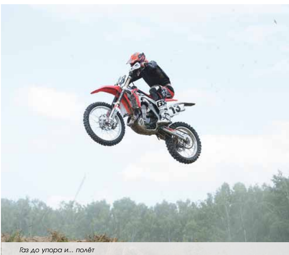
Газ до упора и... полёт