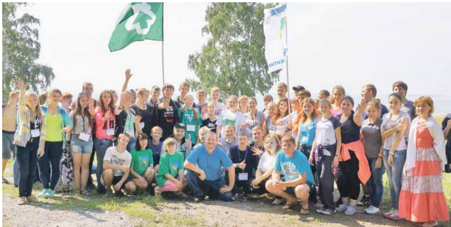
Команда единомышленников Новосибирского района

Под девизом «Новосибирский район — территория развития» в Боровом прошёл Открытый молодёжный областной экологический форум. В течение трех дней юные защитники природы более чем из половины районов Новосибирской области обсуждали уже созданные природоохранные проекты и учились отстаивать собственные идеи.