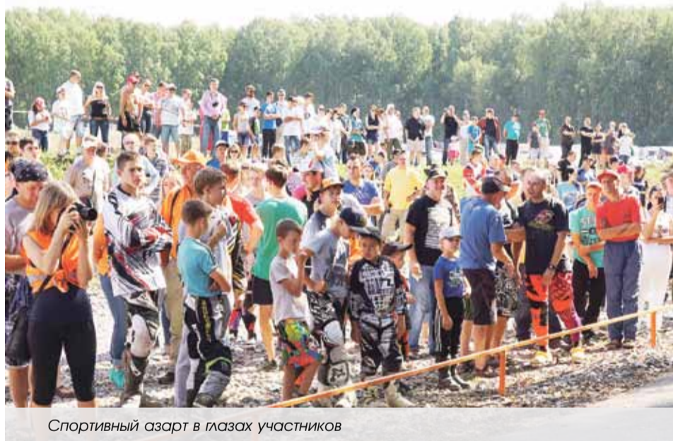
Спортивный азарт в глазах участников