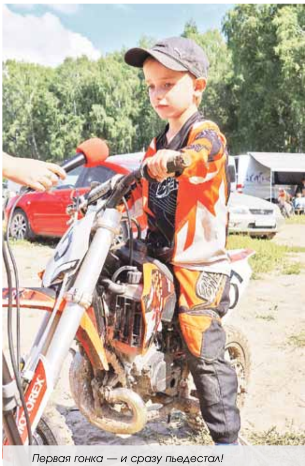
Первая гонка — и сразу пьедестал!