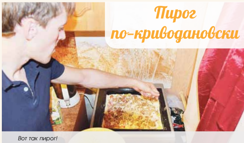
Вот так пирог!