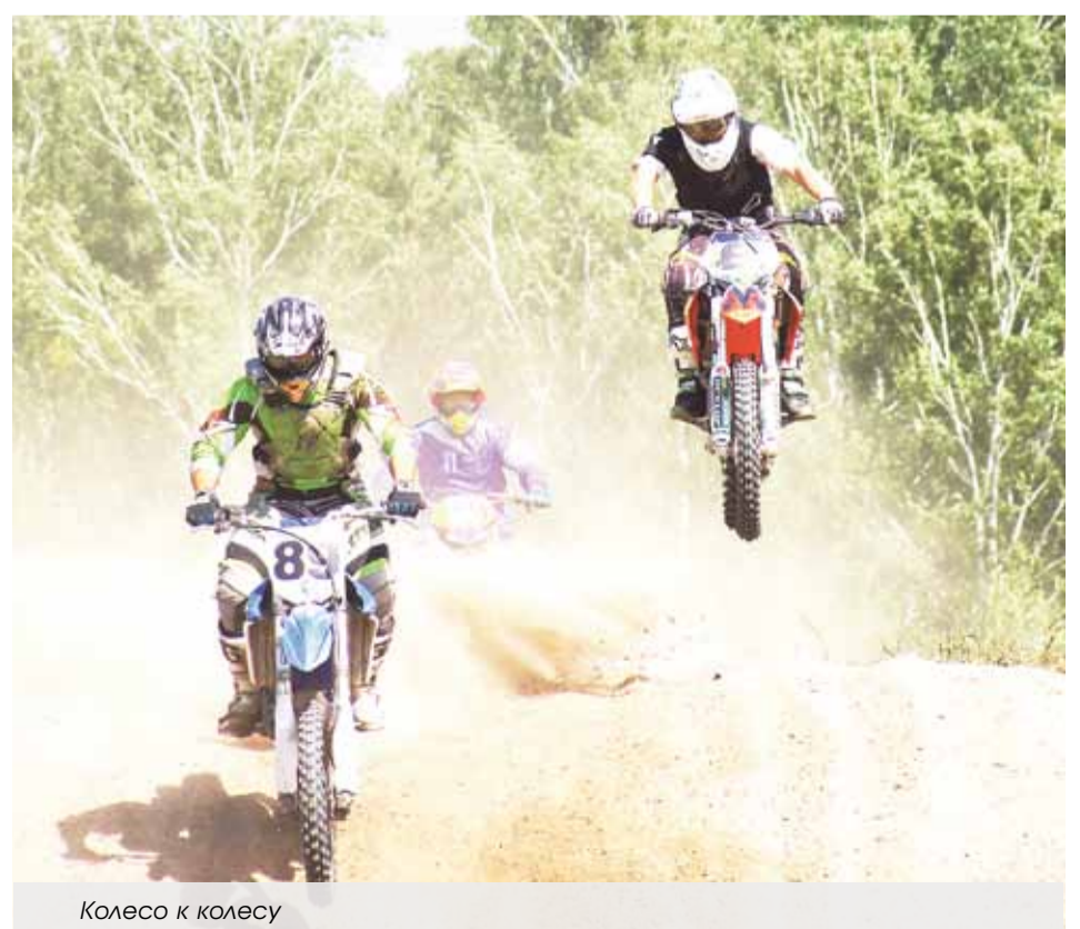
Колесо к колесу