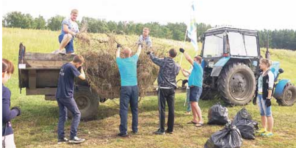
Два трактора мусора собрали юные экологи