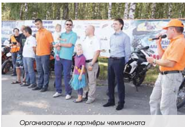
Организаторы и партнёры чемпионата

Эндуро-кросс — дисциплина мотоспорта. Соревнования проводятся на трассе, включающей в себя различные препятствия естественного характера: камни, валуны, брёвна, песок, грязь, воду, крупногабаритные шины.