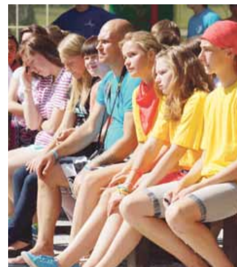
За экопроектами — будущее района

Наверное, читатели ждут, когда НР расскажет про отдых молодых эколо-